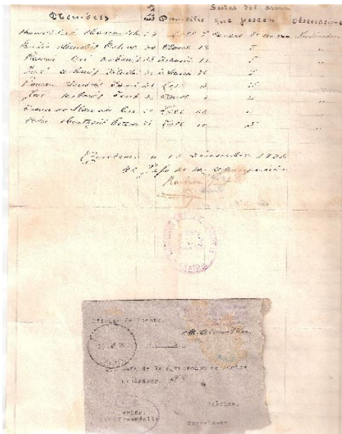
Llista de voluntaris de l'Associació "Acción Ciudadana"

Ara fa 34 anys, concretament el dia 13 de desembre de l'any 1934 es féu una de les moltes llistes que durant els anys anteriors a la guerra civil i a la postguerra es feren a partir de gent dels municipis que s'oferien voluntaris a realitzar un servei de guàrdia i custòdia dels nostres conciutadans avantpassats. Aquests es feien anomenar "Agrupación de la Acción Ciudadana". En la llista hi constava el nom, la edat, el domicili, les senyals de la seva arma i alguna observació.