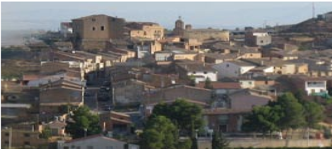
Vista panoràmica del poble de Torrebesses

Amb la participació de totes les associacions del poble i esperem que sigui també amb la col·laboració de tots els veïns