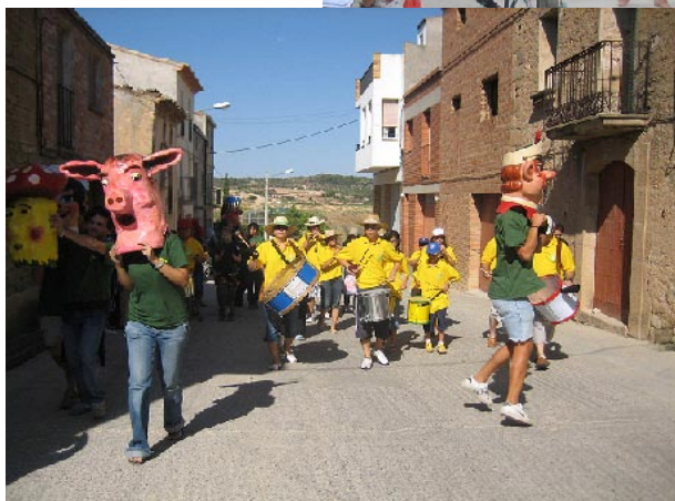
Fotos de la Festa Major de Sant Salvador 07